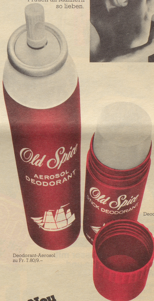
Deodorant-Aerosol zu Fr. 7.80/9.-