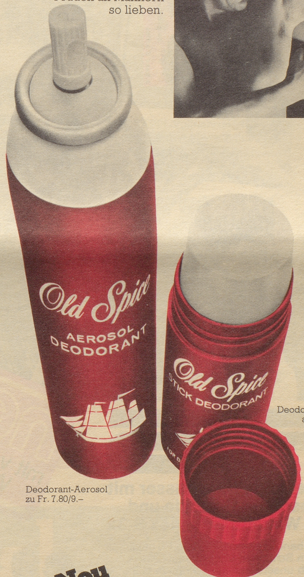
Deodorant-Stick ab Fr. 4.40