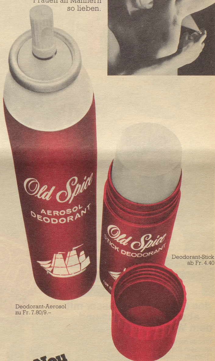
Deodorant-Aerosol zu Fr. 7.80/9.–