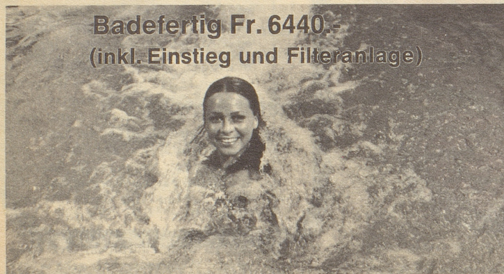
Badefertig Fr. 6440.- (inkl. Einstieg und Filteranlage)