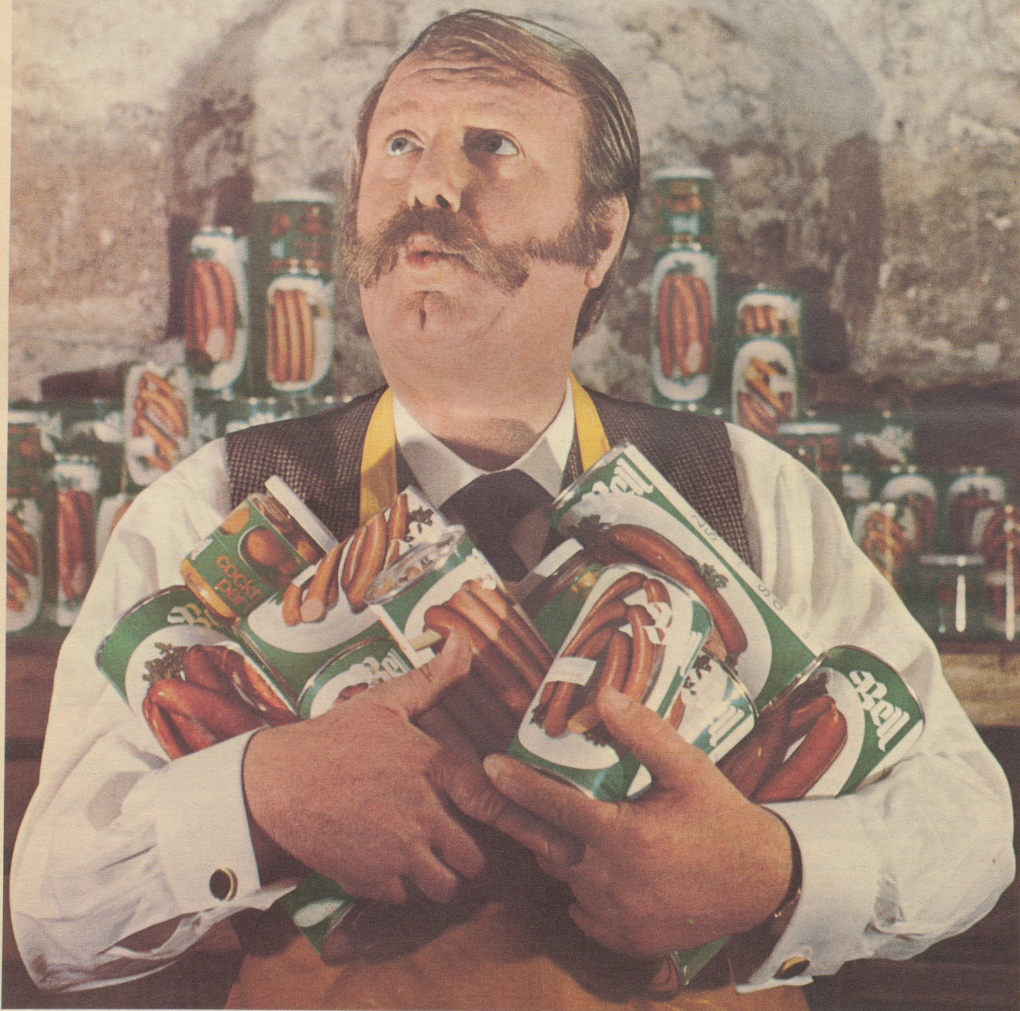
St. Galler-, Zürcher-Schüblige, Frankfurterli, Bellwurstli, Wienerli, Cocktail - Party