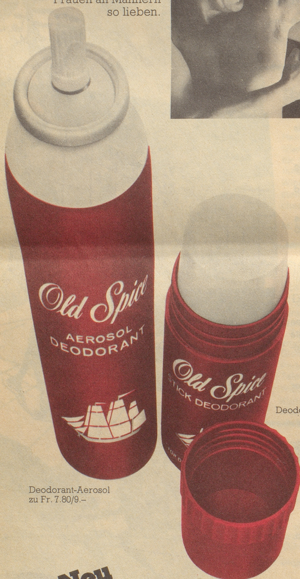
Deodorant-Aerosol zu Fr. 7.80/9.–