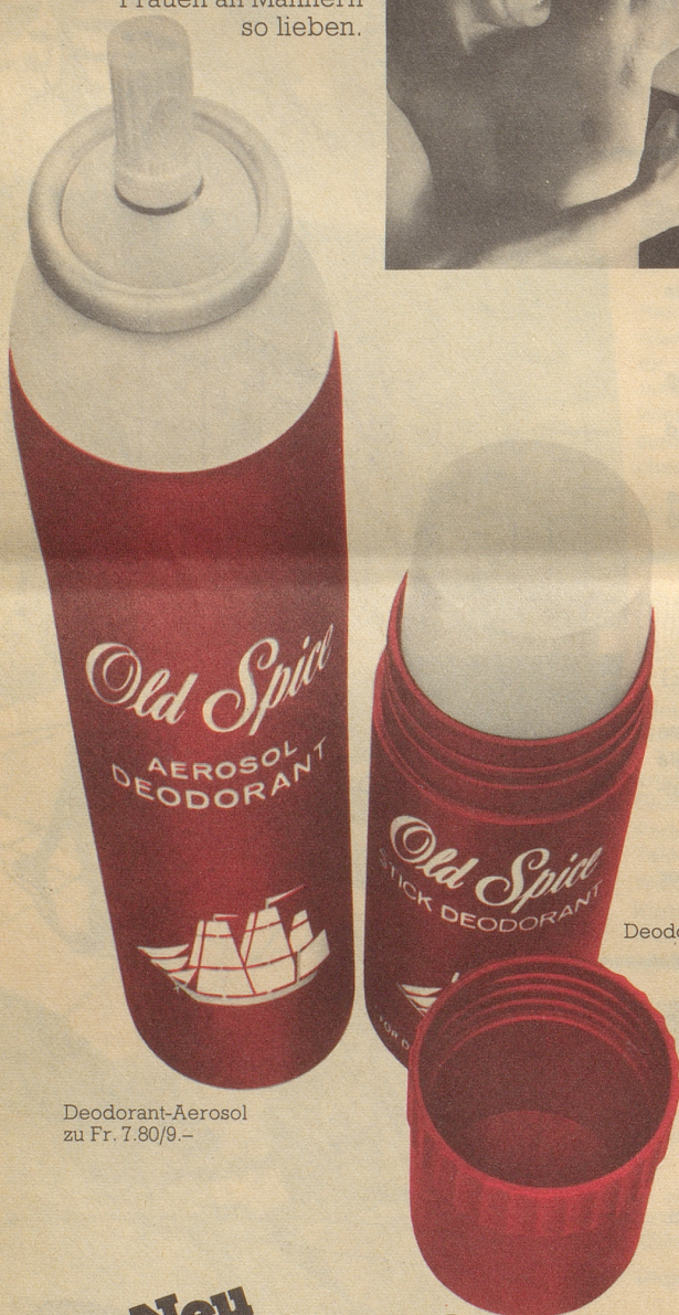
Deodorant-Aerosol zu Fr. 7.80/9.–