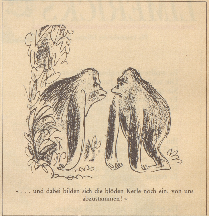
«... und dabei bilden sich die blöden Kerle noch ein, von uns abzustammen!»

Ich meine dies: Der Mensch wird im Durchschnitt immer älter, und im stets länger werdenden Altersabschnitt seines Lebens ist er immer mehr allein, wird er einsamer. Da gewinnt das Halten eines Hundes tatsächlich noch ganz andere Aspekte, auch im Hinblick auf die sich vergrößernde Freizeit. Und zum andern: Wir tun alles mögliche, damit Jugendliche zu einer vernünftigen Freizeitbeschäftigung kommen. Da ist die Haltung eines Vierbeiners nun gewiß nicht das Letzte, sondern wäre recht eigentlich der Förderung würdig. Ja, ich möchte sagen: «usw.» hinter «Wiesen» hin oder her – das Leben in