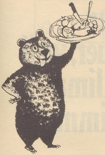
Ueli der Schreiber: