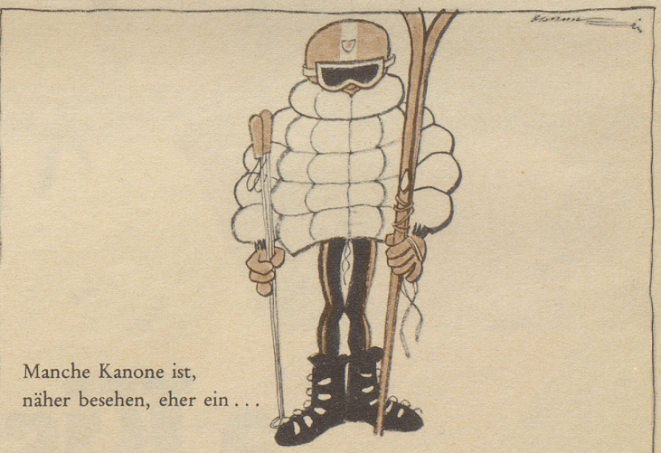
Manche Kanone ist, näher besehen, eher ein ...