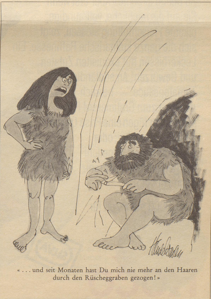
«... und seit Monaten hast Du mich nie mehr an den Haaren durch den Rüscheggraben gezogen!»

Arme Wesen! Zwar kann nicht von echter Tragik die Rede sein, aber das hindert ja nicht, daß sich die Opfer einer so wackligen Selbstverblendung in ihrer leicht angegrunzelten Haut ziemlich unglücklich fühlen. Hätten sie den Mut und das Selbstvertrauen, sich aus der krampfhaft festgehaltenen Weibchen-Attitüde zu lösen, um mit Grazie zu altern, so müßten sie keine Verehrer erfinden. Die würden sich dann nämlich mit allem Respekt von selbst einstellen.