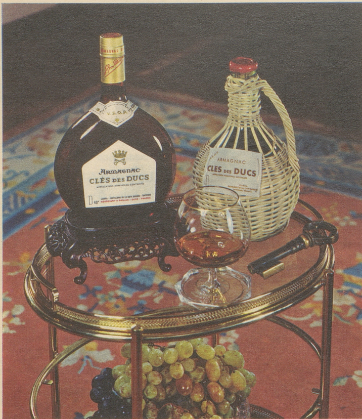
Armagnac CLES des DUCS, die Marke des Kenners

Generalvertretung: Emil Benz Import AG, 8037 Zürich