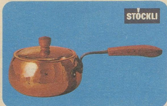
Burgunder-Pfanne mit Deckel, Nr. 7705, 18 cm Ø Fr. 45.90, 14 cm Ø Fr. 36.80, für Fondues und Beilagen.