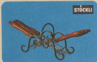
Burgunderspiess-Garnitur, Nr. 7965, Fr. 39.50, für Fondue Chinoise oder alle Arten von Beilagen oder Eintopfgerichten.