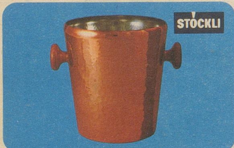
Weinkühler, Nr. 7171, Fr. 65.—, Höhe 21 cm, Ø oben 18 cm, für den gepflegten Tisch.