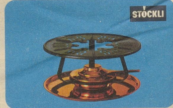
Réchaud, Nr. 7531, Fr. 29.90, für Fondue- und Flambierpfannen, Servierkasserollen oder Bowlen.