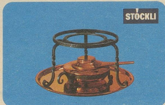
Réchaud, Nr. 7545, Fr. 45.90, für Burgunder-Pfannen und für die Türkische Kaffeekanne.