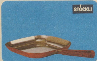
Steakpfanne «Lausanne», Nr. 7791, Fr. 49.80, speziell für Fleischgerichte, aber auch für Fische und Geflügel.