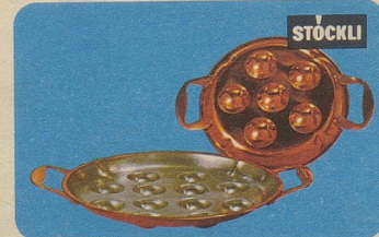
Schneckenpfanne, Nr. 7933, 6teilig Fr. 26.80, 12teilig Fr. 35.—.