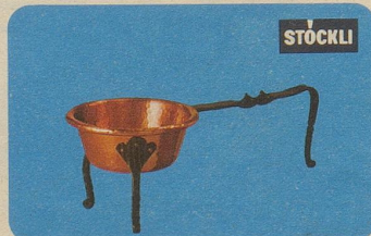
Tessiner Bratpfanne, Nr. 7051, Fr. 22.50, ein Schmuckstück für jeden Haushalt.