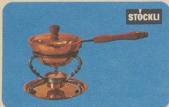
Butter- und Saucenwärmer, Nr. 7577, Fr. 39.80, Nr. 7575 Fr. 31.50 (kleineres Modell).