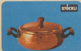
Servierkasserolle mit Deckel, Nr. 7803, Fr. 46.70, für Fondue Chinoise oder alle Arten von Beilagen oder Eintopfgerichten.