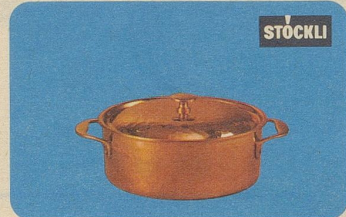
Taverna-Topf, mit Deckel, Nr. 7881, 14 cm Ø Fr. 35.—, 16 cm Ø Fr. 39.80, 18 cm Ø Fr. 46.50, für Spezialitäten, Ragouts usw.