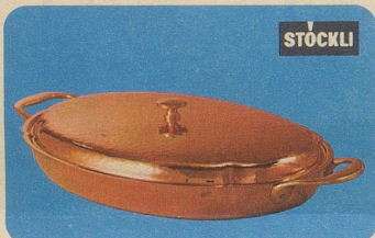
Gratinplatte, Nr. 7855, Fr. 97.70, für alle Arten von Gratins, für Fleisch-, Fisch- oder Geflügelgerichte oder Beilagen.