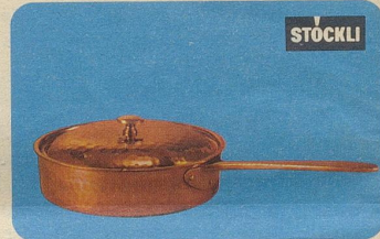
Locanda-Pfanne, Nr. 7891, Fr. 52.50, für alle Arten von Fleisch-, Fisch-, Geflügel- oder Eintopfgerichten.