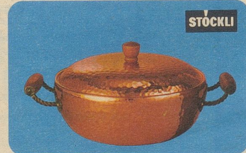
Pot-au-feu mit Deckel, Nr. 7835, Fr. 79.—, für Fleisch-, Fisch- oder Geflügel-Eintopfgerichte oder für Suppen.