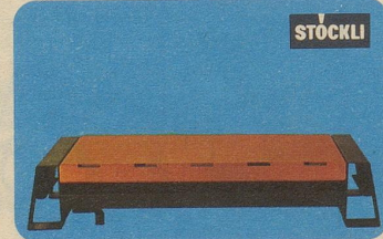
Plattenwärmer «Lausanne», Nr. 7595, 28 cm lang, Fr. 38.50, 40 cm lang Fr. 46.70, mit Löschvorrichtung.