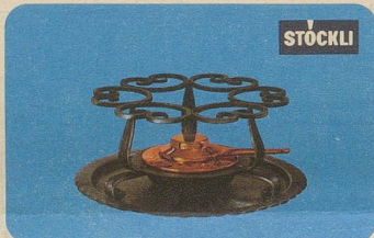
Réchaud, Nr. 7543, Fr. 48.50, für Fondue- und Flambierpfannen, Servierkasserollen, Pot-au-feu oder Bowlen.