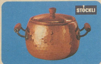
Bowlé mit Deckel, Nr. 7745, Fr. 79.—, für Feuerzangen-Bowlen, Fleisch- und Fischsuppen oder Eintopfgerichte.