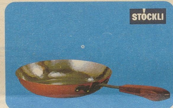
Flambierpfanne rund, Nr. 7761, Fr. 39.—, für Flambier-, Fleisch-, Fisch- und Geflügelgerichte.