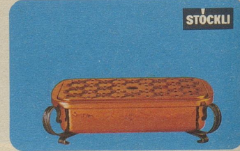
Plattenwärmer, Nr. 7591, Fr. 61.—, Länge 31 cm, mit formschönen schmiedeisernen Beschlägen.