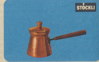
Türkische Kaffeekanne mit Deckel, Nr. 7911, Fr. 33.50, für echt türkischen Kaffee.