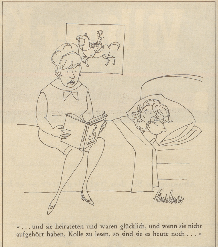
«... und sie heirateten und waren glücklich, und wenn sie nicht aufgehört haben, Kolle zu lesen, so sind sie es heute noch ...»

Da gibt es den Bürochef, der sich darüber aufhält, daß Schulentlassene Dichter kennen, aber keine einwandfreien Geschäftsbriefe zu verfassen gelernt haben, daß sie keinen Schreibmaschinenunterricht «gehabt» haben, damit man sie