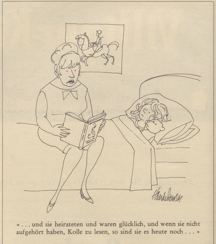
«... und sie heirateten und waren glücklich, und wenn sie nicht aufgehört haben, Kolle zu lesen, so sind sie es heute noch ...»

Da gibt es den Bürochef, der sich darüber aufhält, daß Schulentlassene Dichter kennen, aber keine einwandfreien Geschäftsbriefe zu verfassen gelernt haben, daß sie keinen Schreibmaschinenunterricht «gehabt» haben, damit man sie