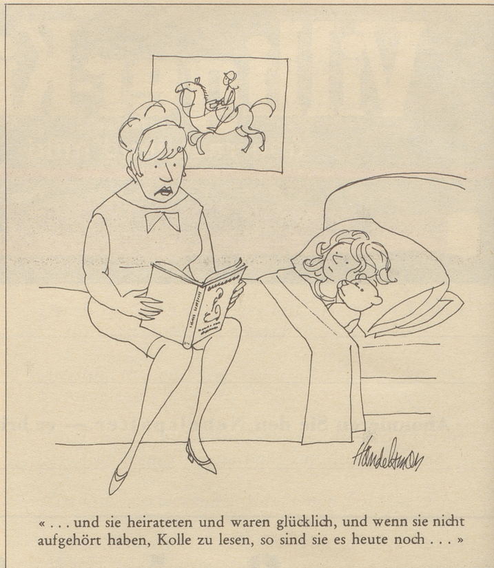
«... und sie heirateten und waren glücklich, und wenn sie nicht aufgehört haben, Kolle zu lesen, so sind sie es heute noch ...»

Da gibt es den Bürochef, der sich darüber aufhält, daß Schulentlassene Dichter kennen, aber keine einwandfreien Geschäftsbriefe zu verfassen gelernt haben, daß sie keinen Schreibmaschinenunterricht «gehabt» haben, damit man sie