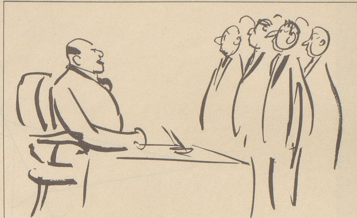
«... meine Herren, der Bernie ist zurück und entschlossen, das Zeitalter der goldenen Toilettenschüsseln dank Ihrem Einsatz neu aufleben zu lassen!»

Diese Erinnerungen machen mich skeptisch gegen die Vorwürfe der Unmoral und der Gefährlichkeit, die Kennzeichen der heutigen Jugend sein sollen. Werde mich einmal erkundigen, ob in den letzten Jahrzehnten in Sachen Unmoral noch Neues erfunden worden ist; kann mir's kaum vorstellen. Jedenfalls hat unser Gewissen keinen