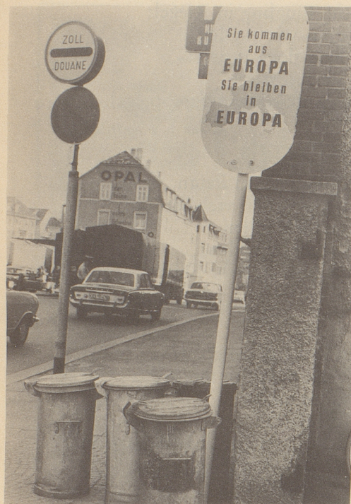
Ein Schnappschuß beim Grenzübertritt

Offen gestanden, ich hatte einige Mühe, den Text auf der Tafel beim Grenzübertritt Lörrach–Basel richtig zu verstehen: «Sie kommen aus Europa, Sie bleiben in Europa.» Eine Begrüßung des Ankommenden war es nicht, eine Warnung natürlich auch nicht! Eine Feststellung? Aber wozu? Immerhin, das Wort «europäisch» sprach mich sympathisch an, weil ich gerne ein Europäer bin. Also indirekt doch eine Art Begrüßung! Aber dann mußte ich überrascht lächeln, denn beinahe wäre ich gestolpert: über die Kehrichtkübel, die mir den Weg aus Europa versperrten, um in Europa zu bleiben.