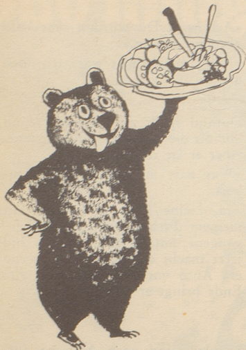
Ueli der Schreiber: