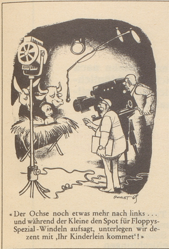
«Der Ochse noch etwas mehr nach links... und während der Kleine den Spot für Floppys-Spezial-Windeln aufsaugt, unterlegen wir den zent mit „Ihr Kinderlein kommet!“»