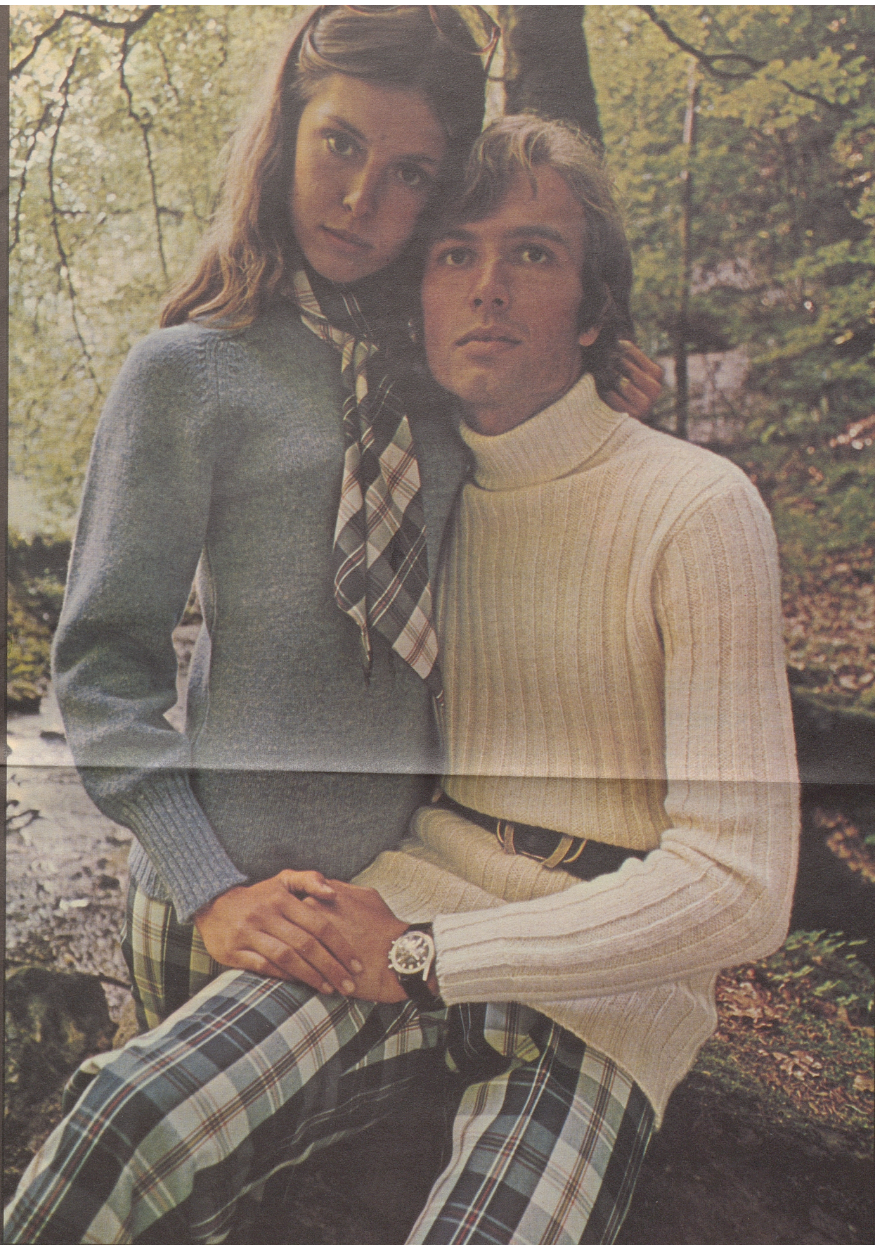
Im Sensetal fotografiert für Kleider Frey und das International Wool Secretariat ☺