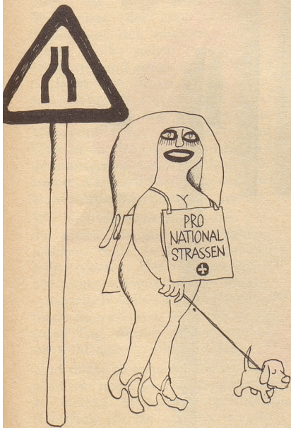
Einsatz des Horizontalgewerbes.