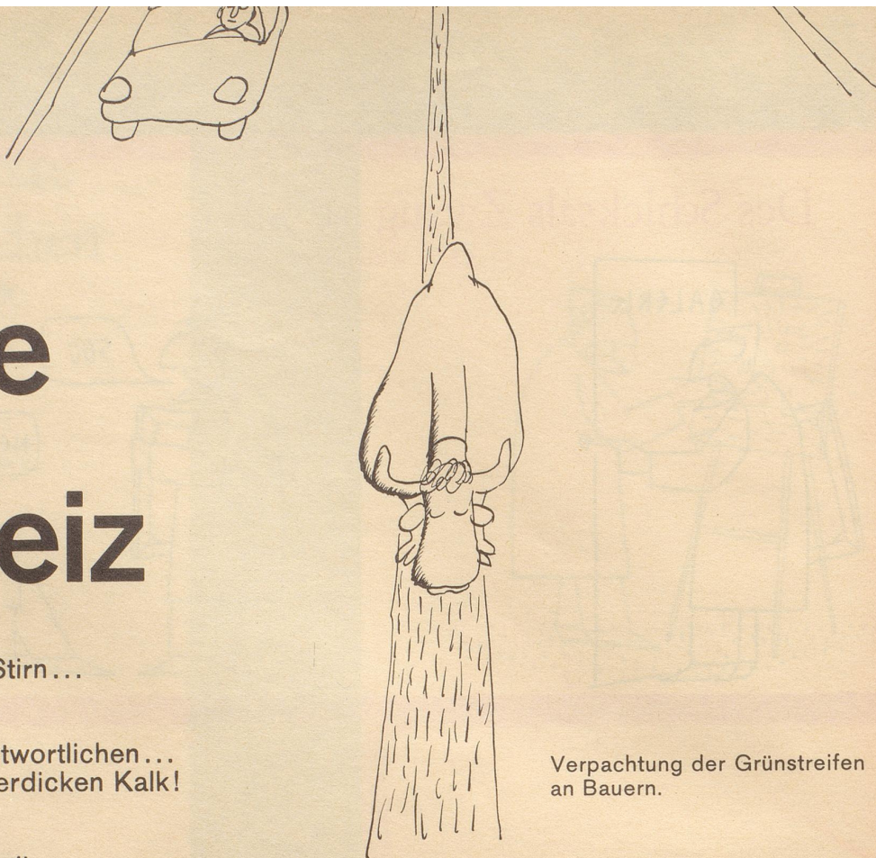
Verpackung der Grünstreifen an Bauern.

Und hier bohrt Fredy Sigg nach Geldquellen für das arme Verdingkind Nationalstraßenbau!