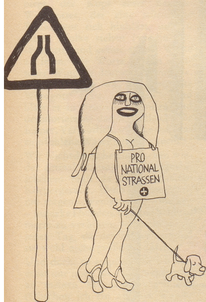
Einsatz des Horizontalgewerbes.