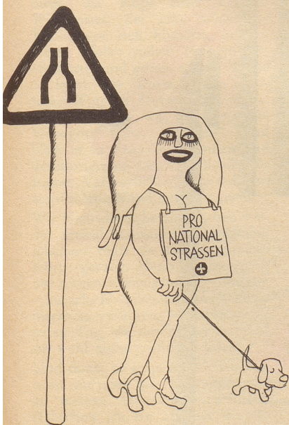
Einsatz des Horizontalgewerbes.