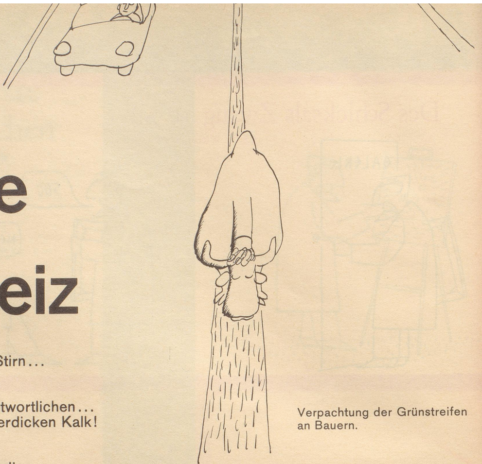
Verpackung der Grünstreifen an Bauern.

Und hier bohrt Fredy Sigg nach Geldquellen für das arme Verdingkind Nationalstraßenbau!