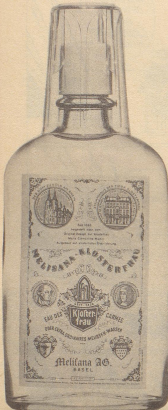
Neu: mit Trinkbecher

für alle, die demnächst in die Ferien gehen!