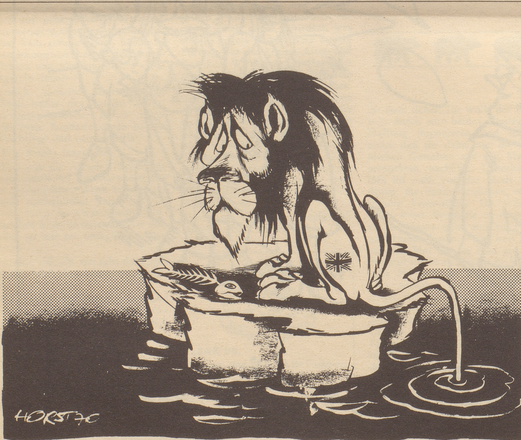
Streikbedingte Lebensmittelknappheit in England!