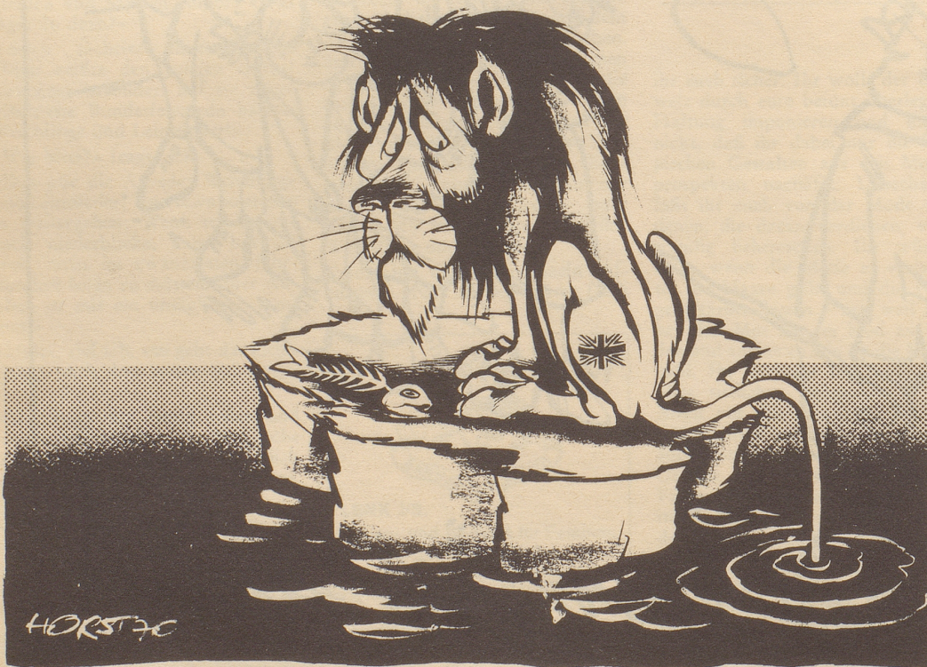
Streikbedingte Lebensmittelknappheit in England!