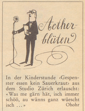
In der Kinderstunde «Gespenster essen kein Sauerkraut» aus dem Studio Zürich erlauscht: «Was me gärrn hät, isch immer schöö, au wänns ganz wüesch isch ...» Ohohr

Naive Frage eines gewöhnlichen Sterblichen: Wär's nicht möglich, ein Hemd mit einer einzigen Kragensstütze und mit einer einzigen,