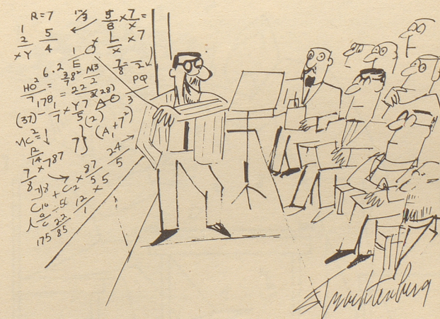
«Natürlich, meine Herren, kann man diese Erkenntnis auch populär-wissenschaftlich ausdrücken – sie heißt dann: zweimalzwei = vier!»