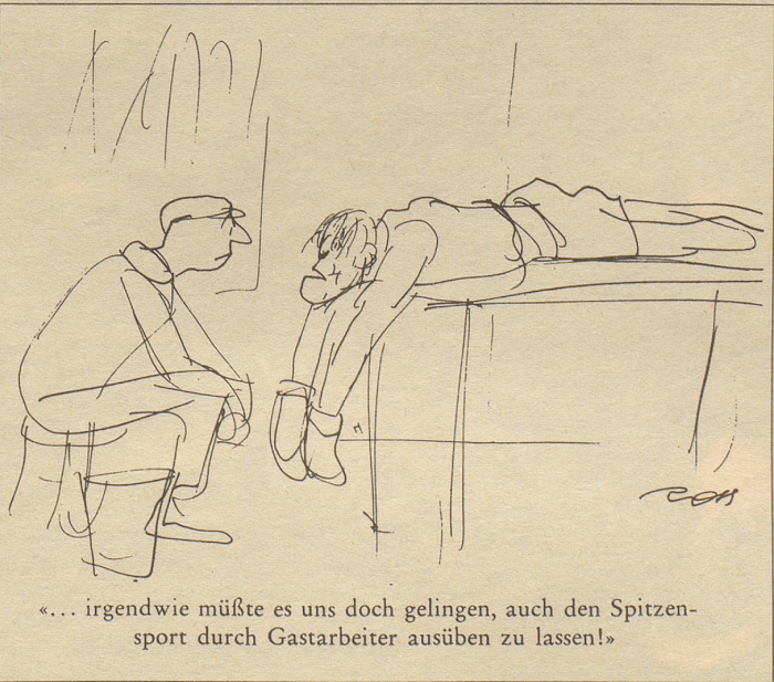
«... irgendwie müßte es uns doch gelingen, auch den Spitzensport durch Gastarbeiter ausüben zu lassen!»