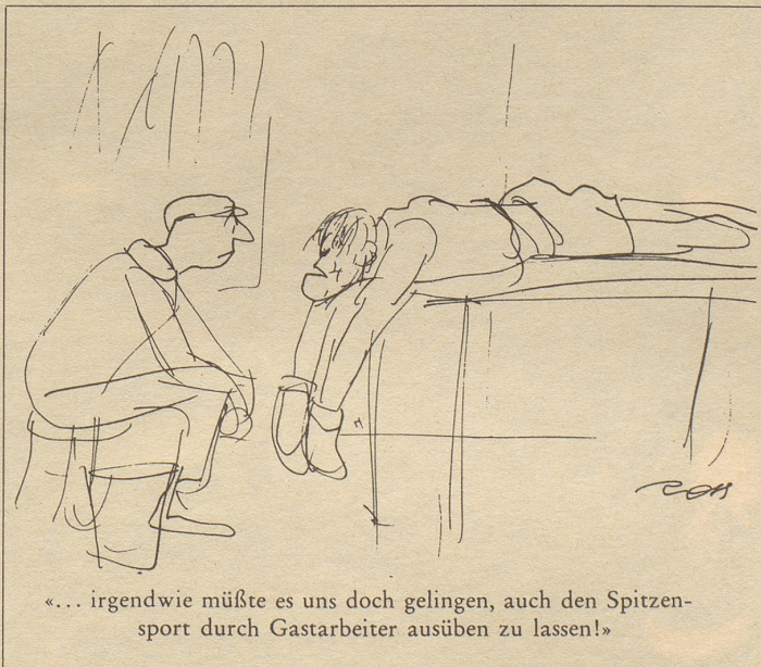
«... irgendwie müßte es uns doch gelingen, auch den Spitzensport durch Gastarbeiter ausüben zu lassen!»