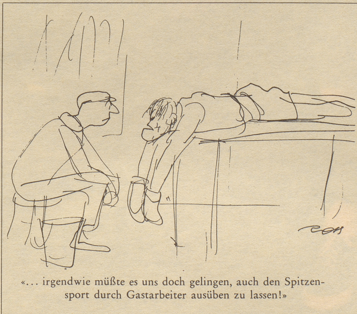
«... irgendwie müßte es uns doch gelingen, auch den Spitzensport durch Gastarbeiter ausüben zu lassen!»