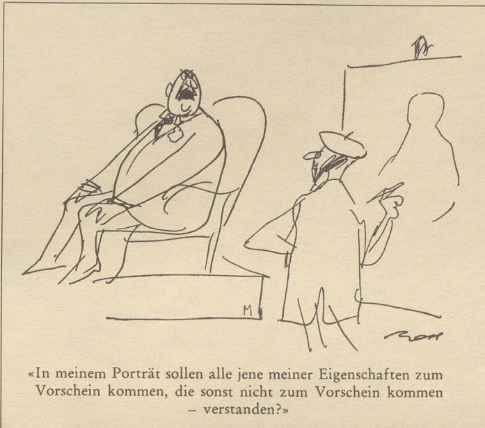
«In meinem Porträt sollen alle jene meiner Eigenschaften zum Vorschein kommen, die sonst nicht zum Vorschein kommen – verstanden?»

Bei dem totalen Streik der Postangestellten in New York sagte der Journalist Bob Orben entschuldigend, die Pöstler wären zu dieser rigorosen Maßnahme gezwungen gewesen. Einen bloßen Bummelstreik hätte nämlich niemand bemerkt. TR