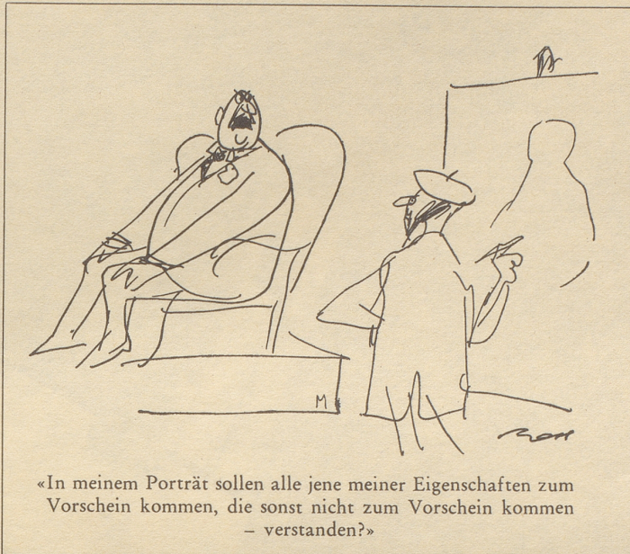
«In meinem Porträt sollen alle jene meiner Eigenschaften zum Vorschein kommen, die sonst nicht zum Vorschein kommen – verstanden?»