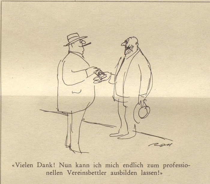
«Vielen Dank! Nun kann ich mich endlich zum professionellen Vereinsbettler ausbilden lassen!»