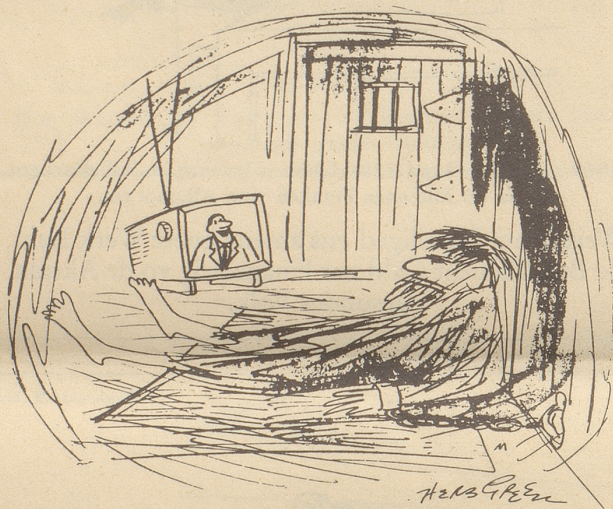
«... schönen guten Tag, alle ihr Stubenhocker!»