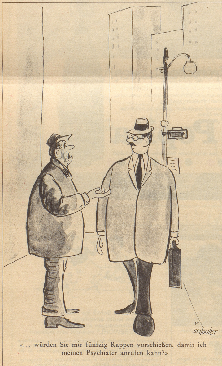
«... würden Sie mir fünfzig Rappen vorschießen, damit ich meinen Psychiater anrufen kann?»