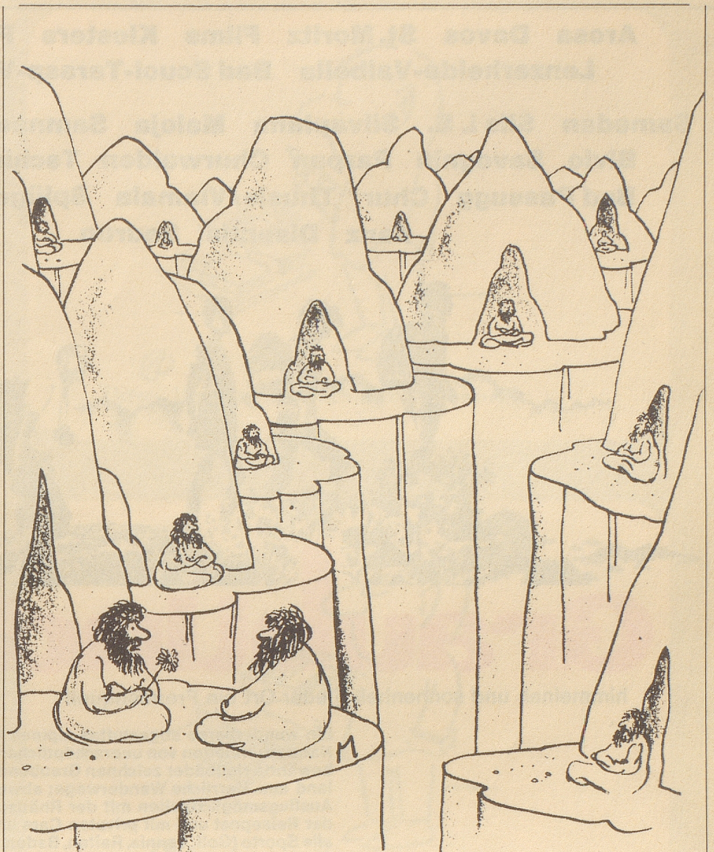
«Himmlisch, diese Meditationen der eidgenössischen Kriegsmaterial-Beschaffungs-Kommissionen ...»

«Blechzivilisation» (gefunden im «Aargauer Anzeiger»). Gemeint ist der vorwiegend aus Autos, Fernsehapparaten und Waschmaschinen bestehende Wohlstand.