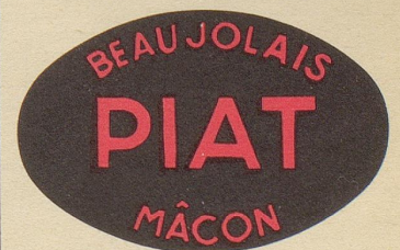
Bezugsquellennachweis: A. Schlatter & Co Neuchâtel

Volljährig und immer noch erst sechs Zähne.