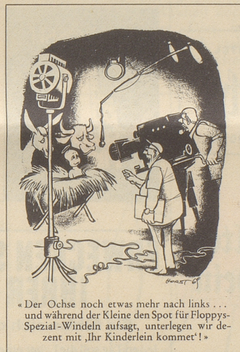
«Der Ochse noch etwas mehr nach links... und während der Kleine den Spot für Floppys Spezial-Windeln aufsaugt, unterlegen wir derzeit mit „Ihr Kinderlein kommet!“»