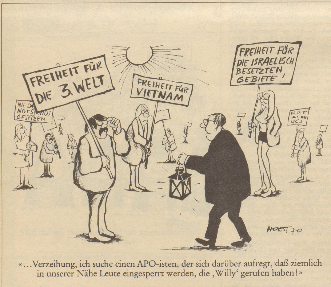
«...Verzeihung, ich suche einen APO-isten, der sich darüber aufregt, daß ziemlich in unserer Nähe Leute eingesperrt werden, die ‚Willy‘ gerufen haben!»

Herr Brandt hat Herrn Stoph, Marionette Moskaus, nach Kassel eingeladen. Brandt wird dort Gelegenheit haben, sich für dieses Kompliment bei Stoph persönlich zu bedanken und ihm vertrauensvoll die Hand zu schütteln. Till