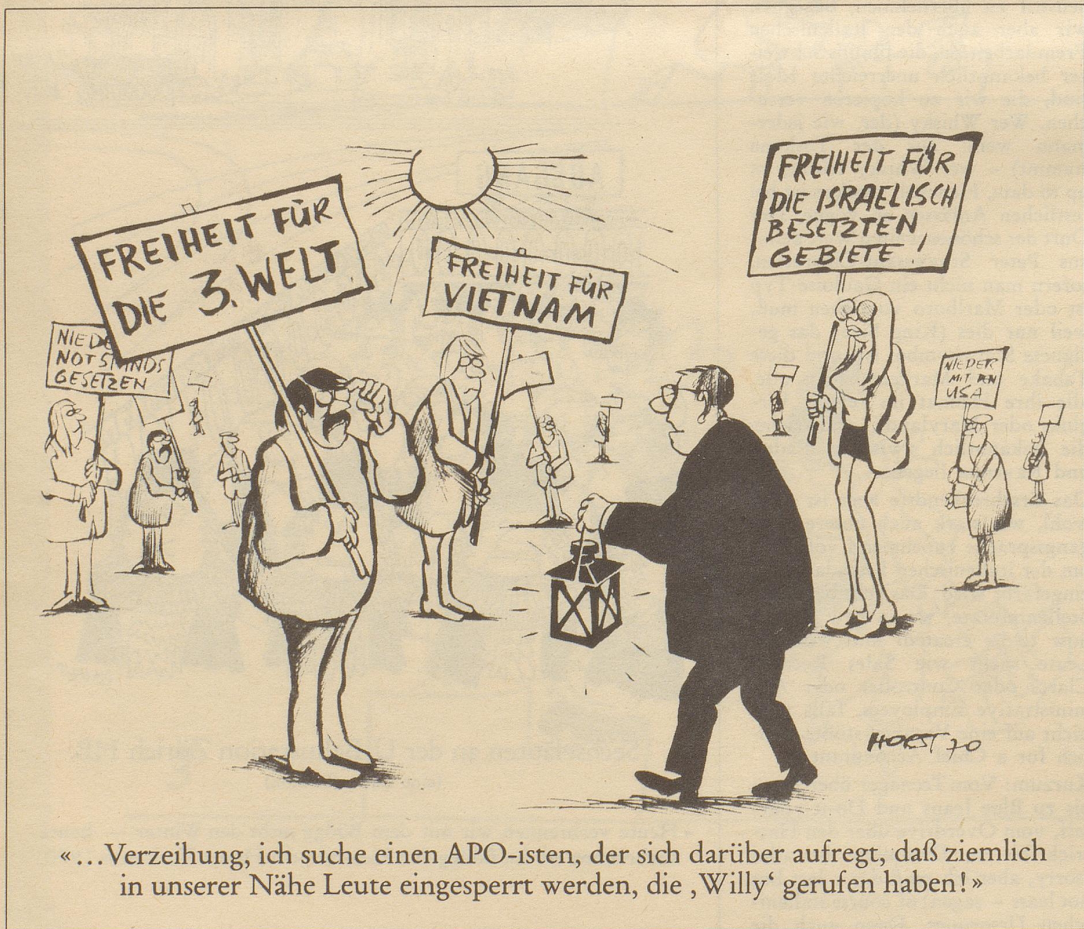
«...Verzeihung, ich suche einen APO-isten, der sich darüber aufregt, daß ziemlich in unserer Nähe Leute eingesperrt werden, die ‚Willy‘ gerufen haben!»

Herr Brandt hat Herrn Stoph, Marionette Moskaus, nach Kassel eingeladen. Brandt wird dort Gelegenheit haben, sich für dieses Kompliment bei Stoph persönlich zu bedanken und ihm vertrauensvoll die Hand zu schütteln. Till