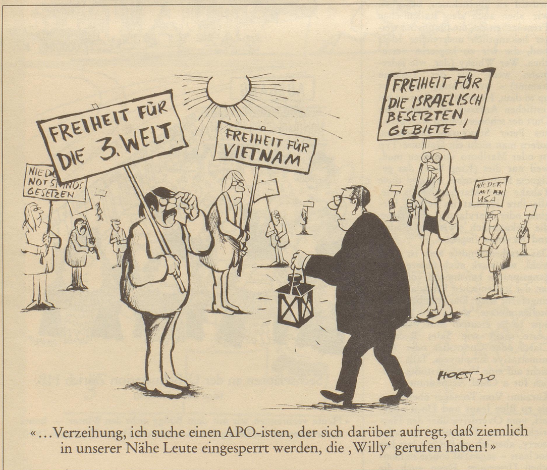
«...Verzeihung, ich suche einen APO-isten, der sich darüber aufregt, daß ziemlich in unserer Nähe Leute eingesperrt werden, die ‚Willy‘ gerufen haben!»