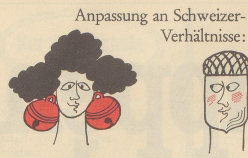
Anpassung an Schweizer-Verhältnisse: Der Schellen-, der Eichle-Look