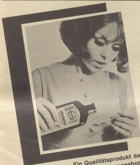
Ein Qualitätsprodukt der Max Zeller Söhne AG, 8590 Romanshorn