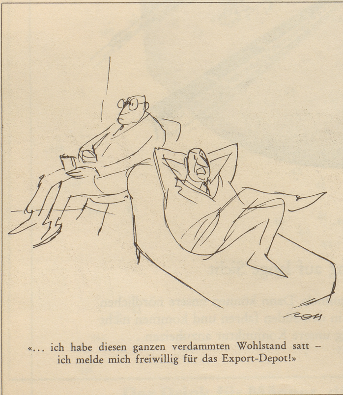
«... ich habe diesen ganzen verdammten Wohlstand satt - ich melde mich freiwillig für das Export-Depot!»

Aber ich, der Bundesweibel, kenne meine Pflicht. Ich habe die Information verteidigt und gesagt: «Schau, Unmögliches kann man nicht von denen verlangen. Beim Militärdepartement haben sie jetzt soviel Scherereien mit Leuten, die Geheimnisse, welche schon lange keine mehr sind, weiterplaudern, daß sie sich nicht auch noch mit irrsinnig anmutenden Plänen von Reckingen befassen können.» So loyal bin ich!