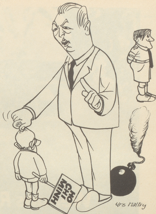
Der böse und der «weniger böse» Sohn des Herrn Kiesinger

Auch der Dumme hat manchmal einen gescheiten Gedanken. Er merkt es nur nicht. Danny Kaye