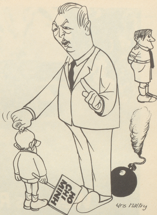
Der böse und der «weniger böse» Sohn des Herrn Kiesinger

Auch der Dumme hat manchmal einen gescheiten Gedanken. Er merkt es nur nicht. Danny Kaye