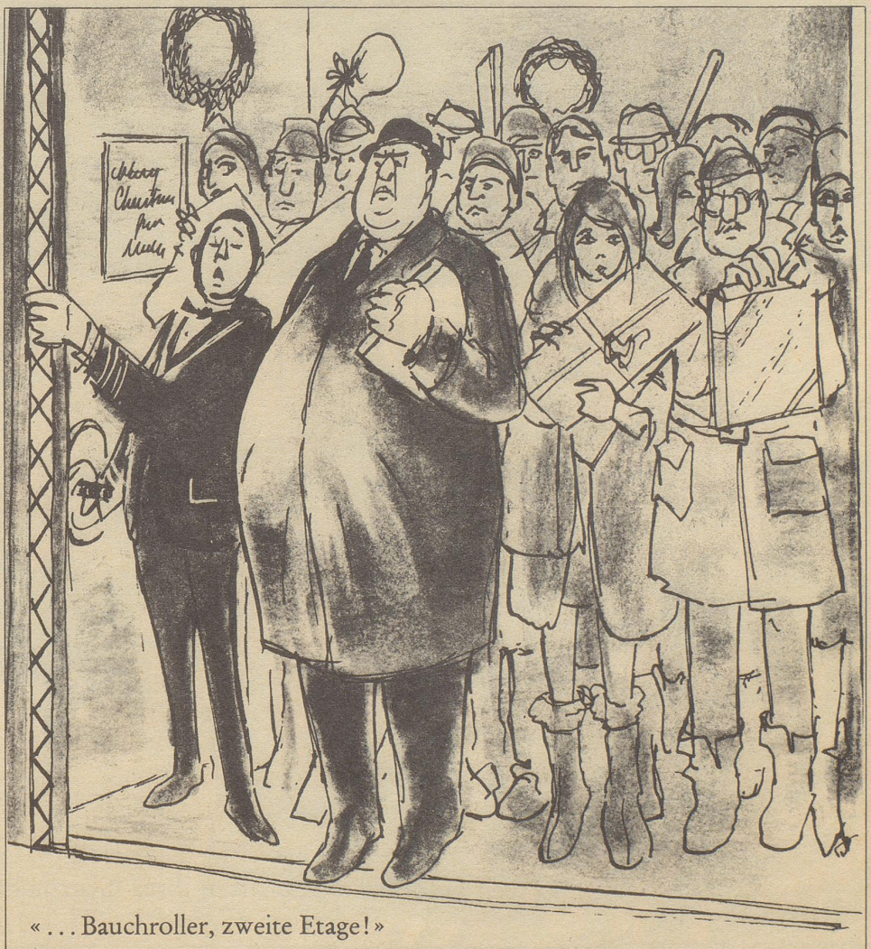
«... Bauchroller, zweite Etage!»