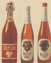
die drei beliebten Merlino Traubensäfte

Merlino Grand Raisin , weiss, moussierend, prickelnd, der passende Auftackt für jedes Fest, Merlino Clairret , rubinrot, fruchtig, passend zu den Mahlzeiten — beide in der schlanken Einwegflasche, zu nur Fr. 2.95 (mit Rabatt), Merlino weiss und rot in der vorteilhaften Literflasche zu nur Fr. 2.65 statt Fr. 2.95 (mit Rabatt).