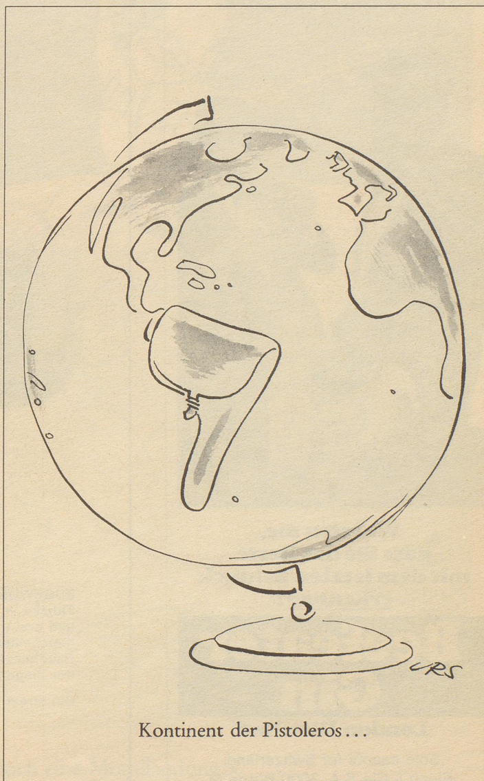
Kontinent der Pistoleros...

Welcher Sprachwissenschaftler wagt in unserem Jahrhundert noch zu behaupten, in der Wendung «untätig zusehen» sei das Wort «untätig» nicht von «Untat» abgeleitet?