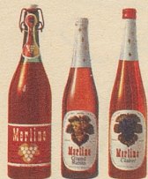
die drei beliebten Merlino Traubensäfte

Merlino Grand Raisin , weiss, moussierend, prickelnd, der passende Auftackt für jedes Fest, Merlino Clairret , rubinrot, fruchtig, passend zu den Mahlzeiten — beide in der schlanken Einwegflasche, zu nur Fr. 2.95 (mit Rabatt), Merlino weiss und rot in der vorteilhaften Literflasche zu nur Fr. 2.65 statt Fr. 2.95 (mit Rabatt).