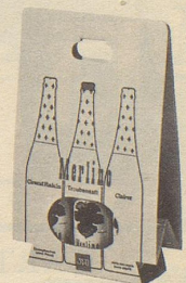
2 Grand Raisin und 1 Clairret im Multipack Fr. 7.85 (statt Fr. 8.85)

Erhältlich in Lebensmittelgeschäften, Reformhäusern, Drogerien und durch unsere Depositäre