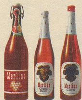
die drei beliebten Merlino Traubensäfte

Merlino Grand Raisin , weiss, moussierend, prickelnd, der passende Auftakt für jedes Fest, Merlino Clairret , rubinrot, fruchtig, passend zu den Mahlzeiten – beide in der schlanken Einwegflasche, zu nur Fr. 2.95 (mit Rabatt), Merlino weiss und rot in der vorteilhaften Literflasche zu nur Fr. 2.65 statt Fr. 2.95 (mit Rabatt).