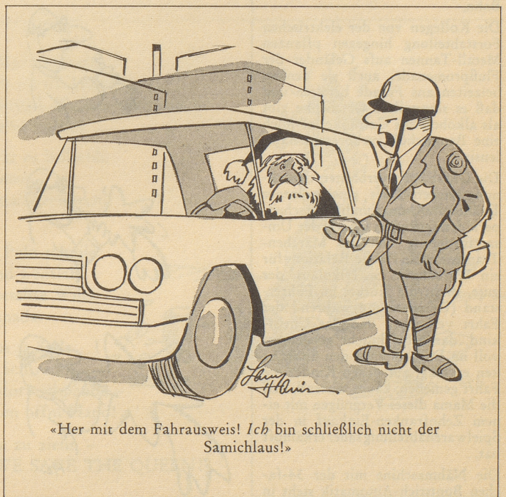
«Her mit dem Fahrausweis! Ich bin schließlich nicht der Samichlaus!»

Das walte Gott, auf dessen Providentia wir Schweizer uns hochhoffiziell noch immer verlassen!