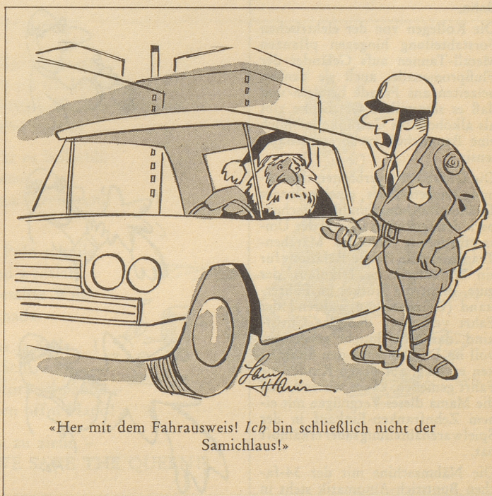
«Her mit dem Fahrausweis! Ich bin schließlich nicht der Samichlaus!»

Das walte Gott, auf dessen Providentia wir Schweizer uns hochhoffiziell noch immer verlassen!