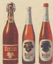
die drei beliebten Merlino Traubensäfte

Merlino Grand Raisin , weiss, moussierend, prickelnd, der passende Auftakt für jedes Fest, Merlino Clairret , rubinrot, fruchtig, passend zu den Mahlzeiten — beide in der schlanken Einwegflasche, zu nur Fr. 2.95 (mit Rabatt), Merlino weiss und rot in der vorteilhaften Literflasche zu nur Fr. 2.65 statt Fr. 2.95 (mit Rabatt).