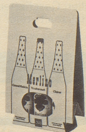
2 Grand Raisin und 1 Clairret im Multipack Fr. 7.85 (statt Fr. 8.85)