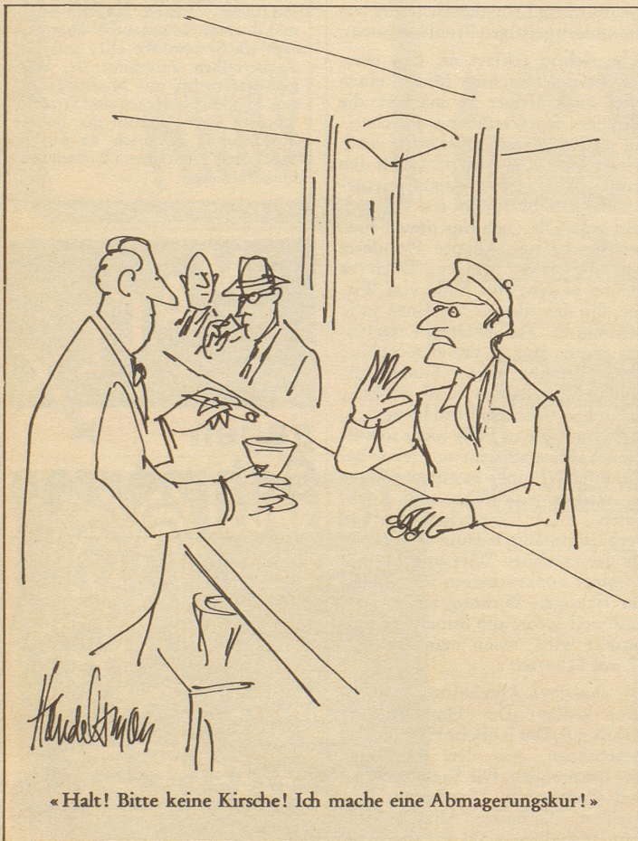
«Halt! Bitte keine Kirsche! Ich mache eine Abmagerungskur!»

jenseits der Grenze, die vielleicht gar nicht wußten, daß es in deutschen Landen so viel Witz gibt. Aber die Beispiele sind, an sich gut, keineswegs immer überzeugend; die Geschichte von dem Tübinger Gogen – so nennt man dort die Weingärtner – dessen Haus vom Gemeindefeuer beanstandet wird, weil das Schlafzimmer unmittelbar neben dem Schweinestall liegt, was ungesund sei, und der darauf erwidert: «Sell glaub i (n)et, mir ischt amol no nie a Sau verreckt», findet sich auch in einem französischen Anekdotenlexikon, und ich wüßte nicht, warum nicht auch ein Bauer im Middle West so reden könnte.