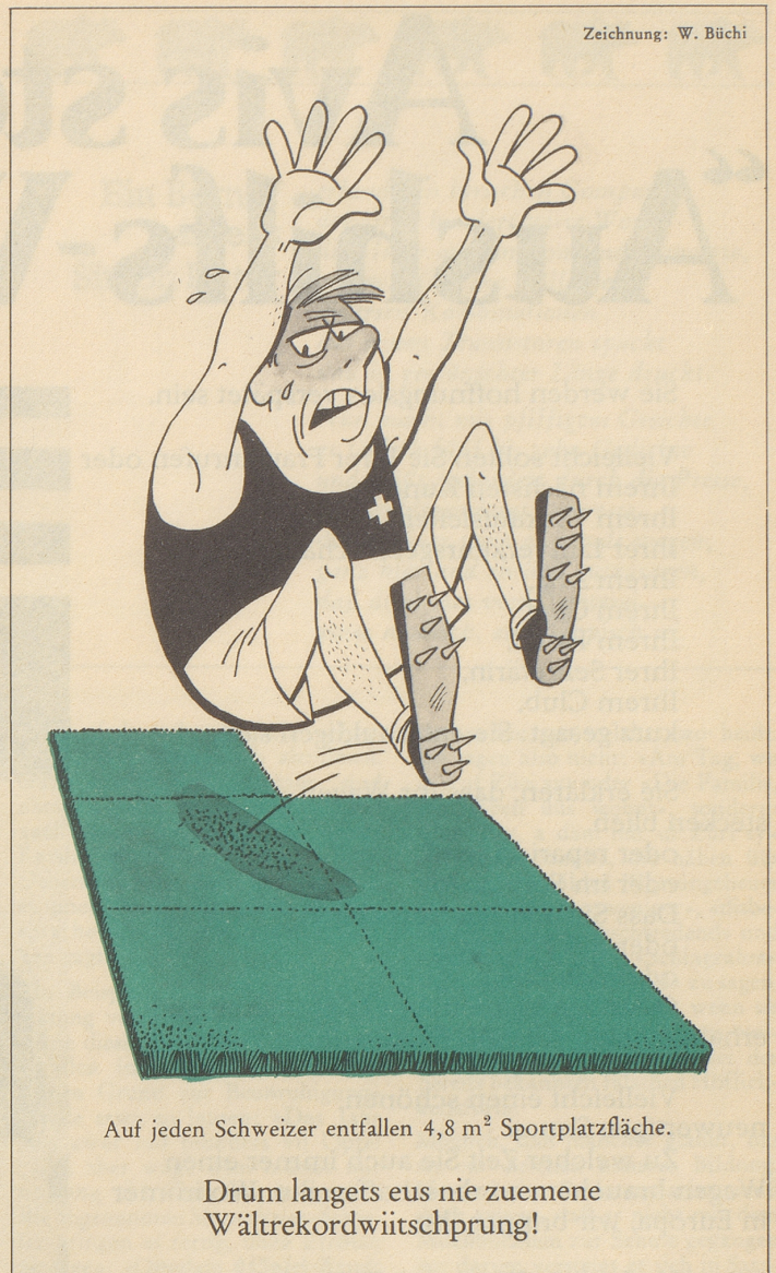
Zeichnung: W. Büchi