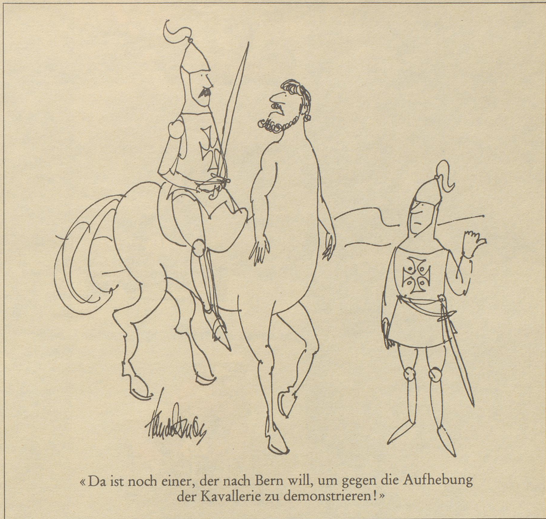
«Da ist noch einer, der nach Bern will, um gegen die Aufhebung der Kavallerie zu demonstrieren!»