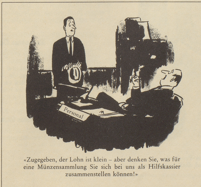
«Zugegeben, der Lohn ist klein – aber denken Sie, was für eine Münzensammlung Sie sich bei uns als Hilfskassier zusammenstellen können!»

Die Tschechen können keine Bewilligungen für Auslandsreisen mehr bekommen. Brauchen sie auch gar nicht mehr. Sollen daheim bleiben und sich der Freiheit freuen, die die Russen meinen.