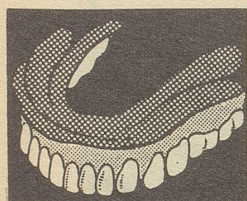
Nur anwendbar bei Prothesen aus Plastik, nicht aber bei solchen aus Gummi oder Metall.

Neu! Die SMIG-Gebiss-Kissen machen den Schmerzen und Beschwerden sofort ein Ende, die durch zu lose sitzende künstliche Gebisse entstehen. Dieses weiche Plastik-Kissen hält die Prothese fest, weil es schmiegsam und elastisch ist wie das Zahnfleisch selbst. Sie können nach Belieben essen, sprechen und lachen! Das Gebiss folgt allen Bewegungen des Kiefers, und Ihr Zahnfleisch schmerzt nicht mehr. Das SMIG-Kissen bleibt immer schmiegsam. Es kann weder hart werden noch das Gebiss beschädigen. Es schmiegt sich gefügig ein, vom ersten Augenblick des Einlegens an. Ohne Geschmack, ohne Geruch, hygienisch! Es lässt sich im Nu reinigen. Die sonst gebräuchlichen Haftmittel werden durch SMIG überflüssig. Verlangen Sie SMIG-Kissen und machen Sie den Beschwerden, die Ihnen Ihr Gebiss verursacht, ein Ende! Erhältlich in allen Apotheken u. Drogerien. Die Packung Fr. 5.80.