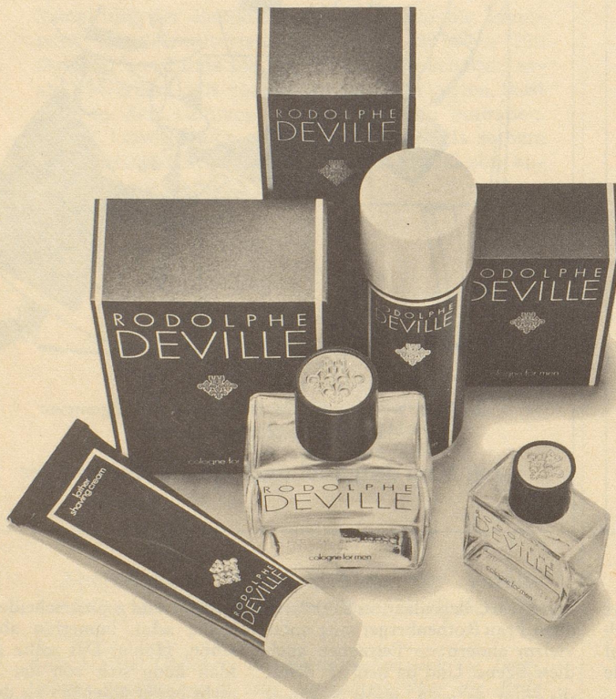
Zur Men's Line Rodolphe Deville gehören ein Cologne im Flacon oder im Spray, ein Pre-Shave, ein After Shave, eine Lather Shaving Cream für Pinselrasuren, ein Hair Tonic.