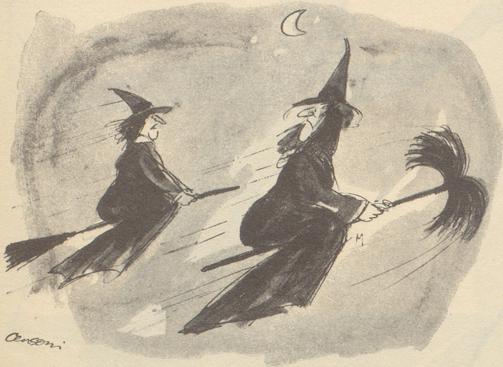
« ... jetzt gehen wir dem Gnägi einmal zeigen, was wir unter einem Erdkampfflugzeug verstehen! »